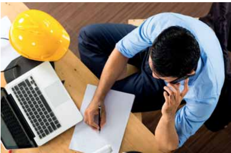
Налогообложению не подлежат самозанятые, имеющие доход ниже установленного минимального заработка.

Сотрудники центра ведется правая разъяснительная работа и по пенсионным отчислениям, и по медицинскому страхованию. Не только в подворовых обходах,