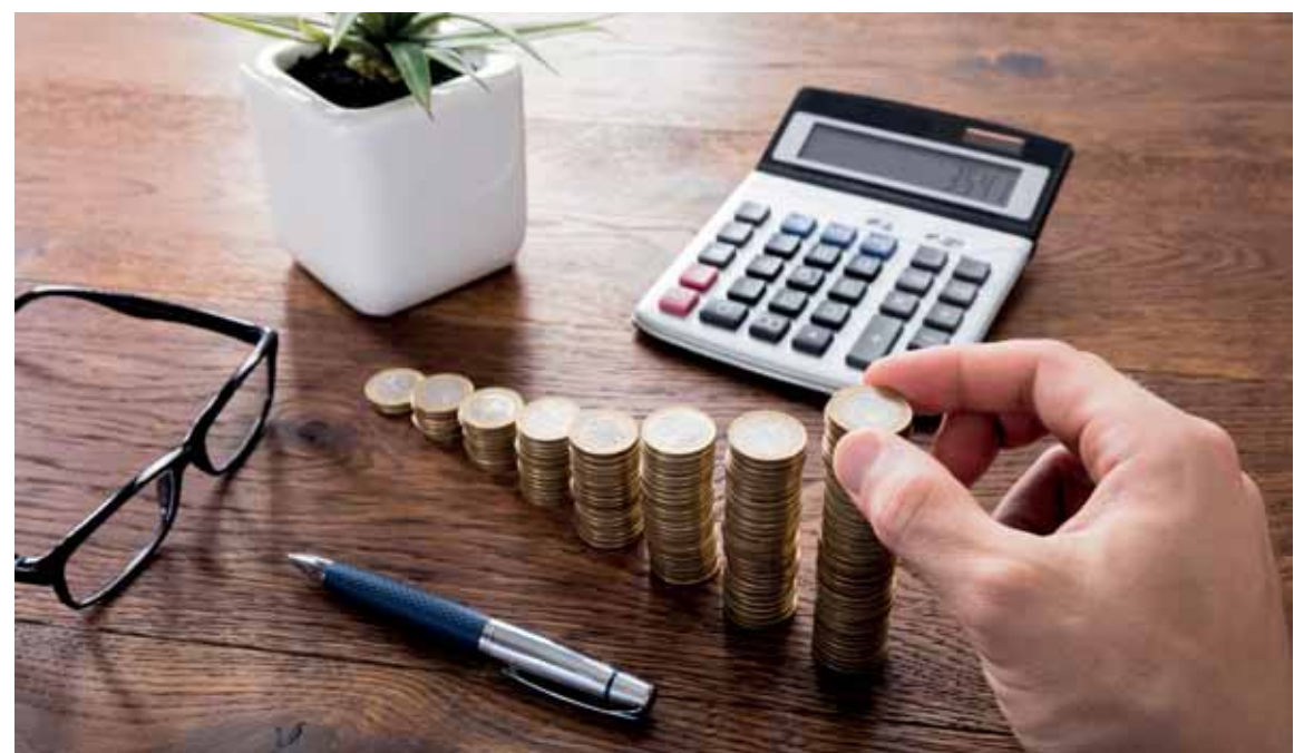
Завершением срока налоговой проверки считается день вручения налогоплательщику акта налоговой проверки.

По словам экс-предпринимательницы, получив извещение, она решила поехать в Балхаш, чтобы разобраться с проблемой на месте. «В городском управлении госдоходов специалисты, работавших 10 лет назад, уже не было, а пришедшие вместо них понятия не имели о моем заявлении. Я написала повторное заявление о прекращении предпринимательской деятельности