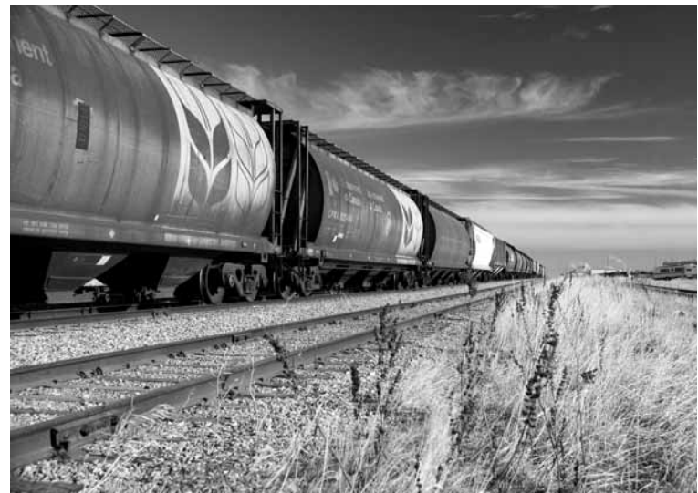
С октября в АО «НК «КТЖ» начнет работу штаб по организации перевозок зерна. Кроме того, при Костанайском и Акмолинском отделениях железной дороги будет вестись круглосуточная работа по погрузке и выгрузке зерна.

Убытки карагандинские мелькомбинаты терпят к тому же из-за