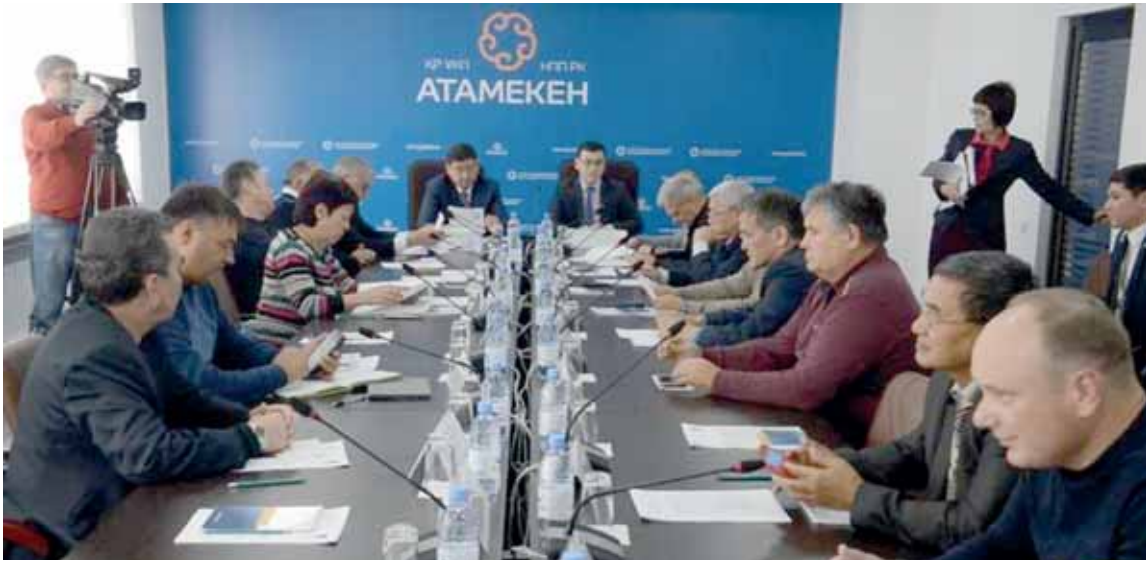
Недавно созданный комитет горнодобывающего комплекса намерен отстаивать права предпринимателей.

Карагандинские горняки хотят привлечь инвесторов в регион. По их мнению, существующий горный кодекс пока не работает в полной мере.