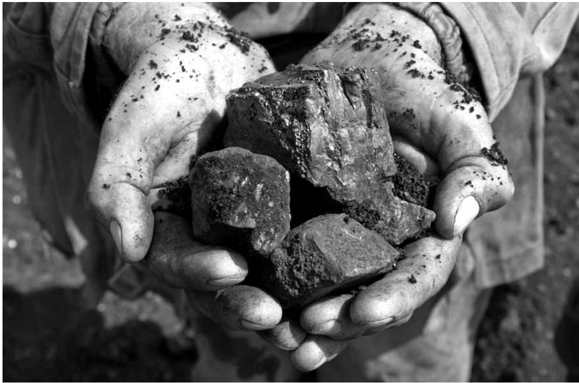
На проведение геологического изучения недр на территории РК предполагается выделить 6,2 млрд тенге бюджетных средств, на 2020 год – 7,0 млрд тенге (при уточнении бюджета могут быть внесены изменения).

Инвестиции же частных компаний в геологоразведку за счет собственных средств по договорам ГИН в период с 2015 года по июль 2018 года по Карагандинской области составили 6 193 711 747 тенге. В том числе в 2015 году – 605 235 038 тенге, в 2016 году – 185 661 792 тенге, в 2017 году – 791 201 777 тенге, в 2018 году – 788 522 521 тенге. Талгат Сатиев отметил, что в данное время за счет собственных средств недропользователей (по договорам) на терри-