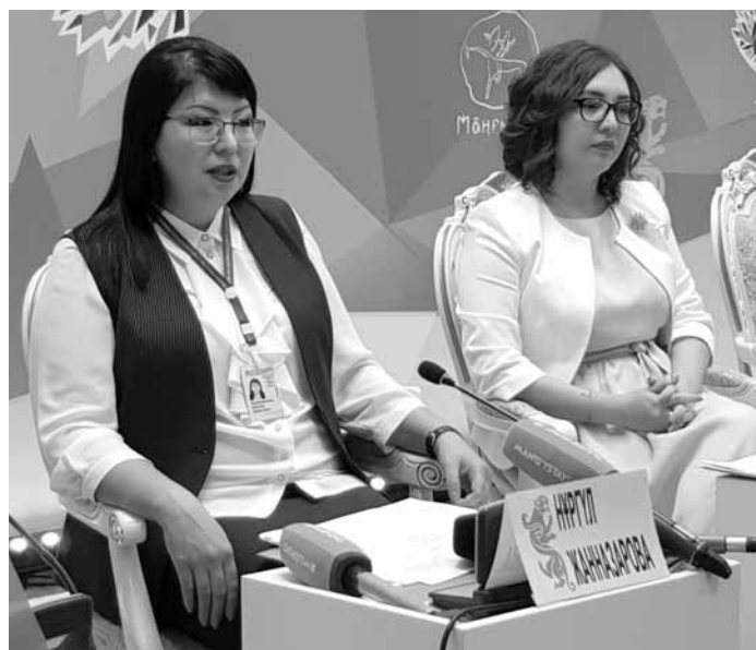
По словам спикеров, работу по внедрению новой системы оплаты труда начали с пересмотра должностных инструкций каждого сотрудника.

Начало 2018 года для госслужащих Мангистауской области оказалось удачным. В акиматах подняли заработную плату в разы. Мангистау стал пилотным регионом, в котором внедрили факторно-балльную шкалу оценки работы госслужащих. Теперь главный специалист сельского акимата вместо 50 тыс. получает 125 тыс. тенге, а у госслужащего на такой же должности в городском акимате оклад вырос с 70 до 130 тыс. тенге. Зарплата акимов сельских округов увеличилась со 130 тыс. до 350 тыс. тенге. Чуть меньше зарплата у руко-