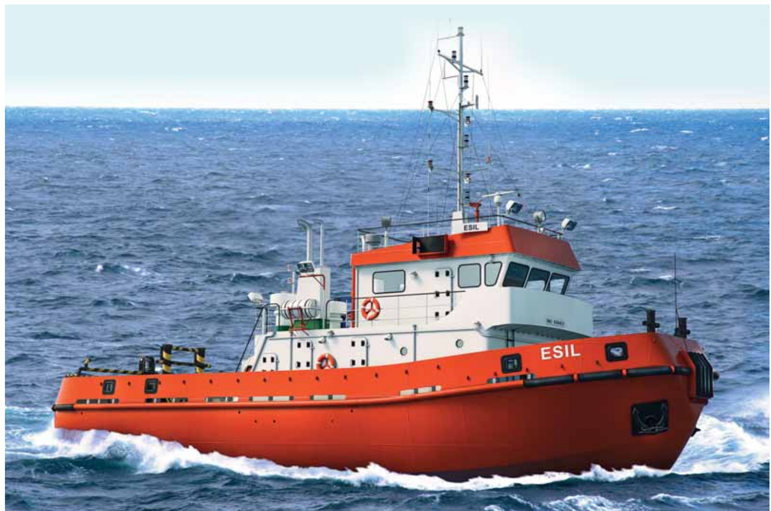
В процессе приватизации будет реализован контрольный пакет акций НМСК «Казмортрансфлот».

«Если раньше мы сталкивались с тем, что нас даже на порог не пускали, то сейчас мы стали одним из лидеров по перевозке нефти на Каспии. Наши суда ходят не только в