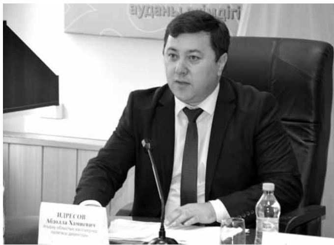
По словам А. Идрисова, из 663 человек, обучившихся по проекту «Бастау» с начала 2018 года, лишь 64 воспользовались льготными кредитами на создание собственного дела.

«В связи с этим было принято решение о проведении разъяснительных встреч с сельским населением с участием актива района, институтов развития предпринимательства, микрокредит-