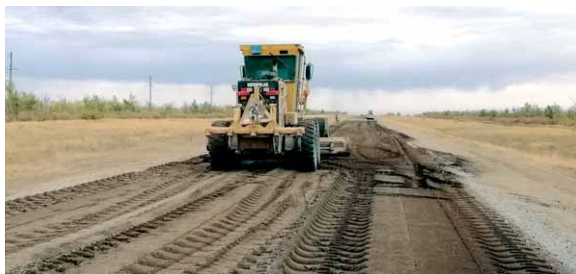
Трасса на Атырау имеет большое значение для движения транзитного транспорта, поэтому за качеством строительства будут следить специалисты Управления автодорог и технадзора.

Общая протяженность дорог в Актюбинской области почти 7 тыс. км. Из них 1885 км республиканского и 1262 км областного значений, остальные – районные. По словам руководителя областного управления пассажирского транспорта и автодорог Аязбая Усмангалиева, сегодня только 56% дорог республиканского значения имеют асфальтовое покрытие. Однако в этом