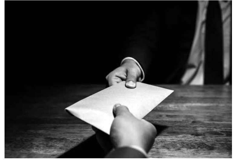
За снижение суммы налогов в госбюджет со 188 млн тенге до 22 млн тенге чиновник получил взятку в размере 10 млн тенге.

За миллион тенге офицер обещал гражданину покровительство и помощь, угрожая, что если мужчина откажется платить, то будет привлечен к уголовной ответственности и выдворен за пределы