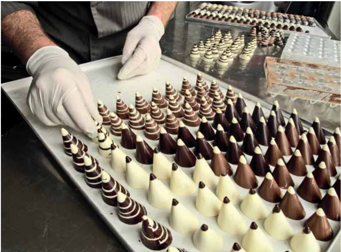
Казахстанцы третий год отстаивают право сладкого продукта на натуральность.

В основном это горнодобывающие предприятия. По словам министра, сейчас неизвестно, сколько человек в результате модернизации останется за бортом, но эти риски поручено акимату Костанайской области просчитать, и как можно быстрее. Пока предлагаемое решение – помочь этим людям получить новые специальности.