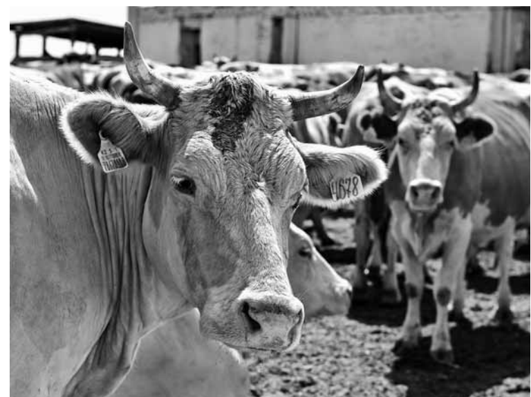
Пять внешних ППУ появятся в пяти районах области, граничащих с Россией.