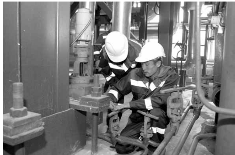
Отопительный сезон в Семее стартовал 1 октября.