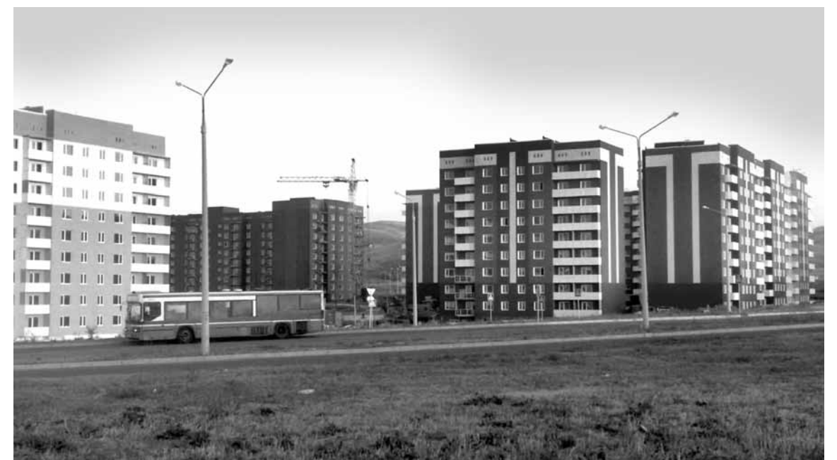
В левобережной части Усть-Каменогорска наблюдается строительный бум. Но достаточно ли этого, чтобы расселить всех желающих?

Но, если представить, что в крупные города региона передедут все сельчане, оставшиеся без работы, то рынку труда Восточного Казахстана придется столкнуться с новыми сложностями. Специалисты департамента прогнозирования АО «Центр развития трудовых ресурсов» Минтруда считают, что одной из главных проблем в сфере занятости ВКО является несоответствие нужных профессий и предложенных резюме. Несмотря на то, что Восточно-Казахстанская область относится к регионам с недостатком рабочей силы, вакансий по техническим специальностям очень много (около 15 тыс. в 2018 году – «КЪ»).