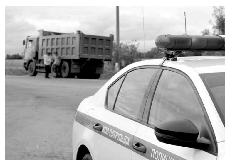
Полицейские СКО выявили 53 преступления в ходе ОПМ «Зерно».

Подобный случай был зафиксирован и ранее, в этом же районе. Только там «предпринимательскую инициативу» своего сотрудника расследовал сам директор ТОО,