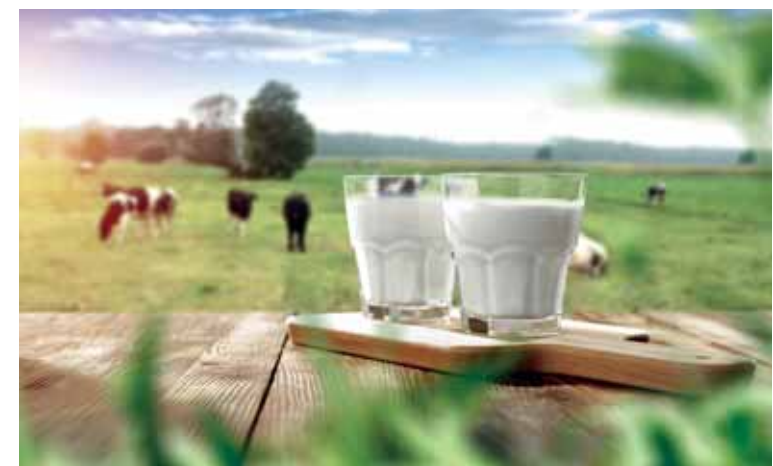
Ранее кооперативы молочного направления в СКО получали по 15 тенге субсидий за литр молока, теперь они будут получать по 10 тенге за литр, снизился и процент возмещения инвестиционных вложений – с 50 до 25%.

Г-н Юрча отмечает, что в последние годы изменились некоторые коды продукции ТН ВЭД и возник вопрос приведения в соответствие шифров, указанных в казахстанском перечне, с современными международными требованиями. А пока этого не произошло, необходимо руководствоваться кодами,