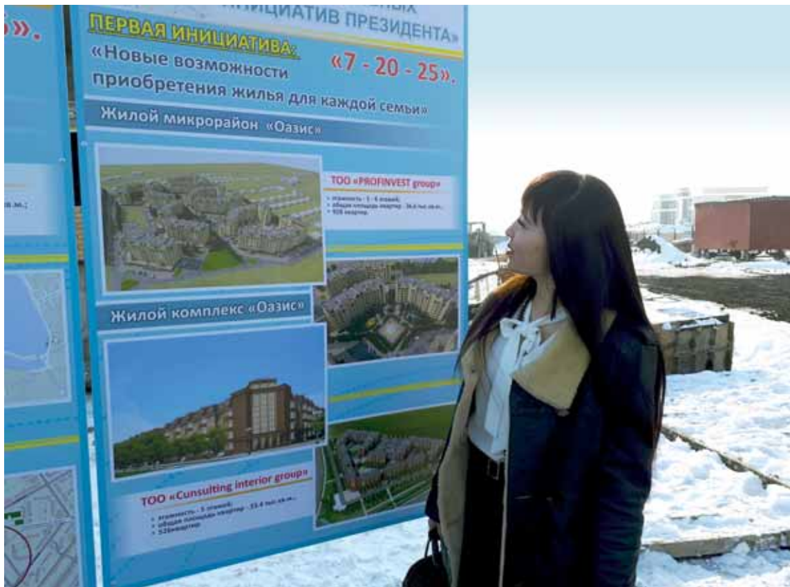
Казахстанцы уверены, что условия такой ипотеки просто неподъемные. Людям сложно накопить первоначальный взнос 20% от стоимости жилья, даже если оно недорогое.

По его словам, чтобы решить этот вопрос, со стороны Национального Банка в госпрограмму внесены изменения, акиматы должны будут выделить в общей сложности 150 млрд тенге для строительства жилья.