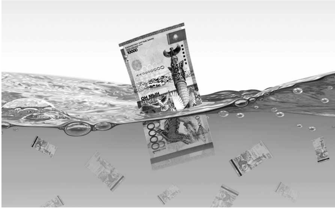
До сих пор остается загадкой, какая именно сумма поступила на счет благотворительного фонда за всю историю его существования. Коллаж: Вячеслав БАТУРИН

Некоммерческая организация закрылась всего два месяца назад, хотя события, спровоцировавшие ее создание, произошли еще в апреле 2015 года. К ныне уже не существующей благотворительной структуре остается немало вопросов, ставших под сомнение разумность перечисления в прошлом на ее счет денежных средств.