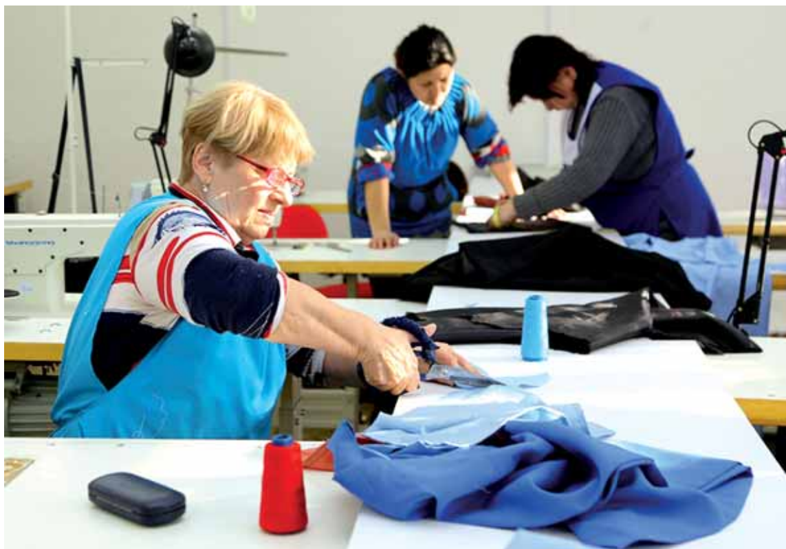
Сегодня предприятия легкой промышленности являются основными потребителями рабочей силы.

«В настоящее время сертификат находится на стадии разработки. По нему постоянно вносятся изменения. Пока я могу лишь сказать, что в документе будут указаны технологии, оборудование, мето-