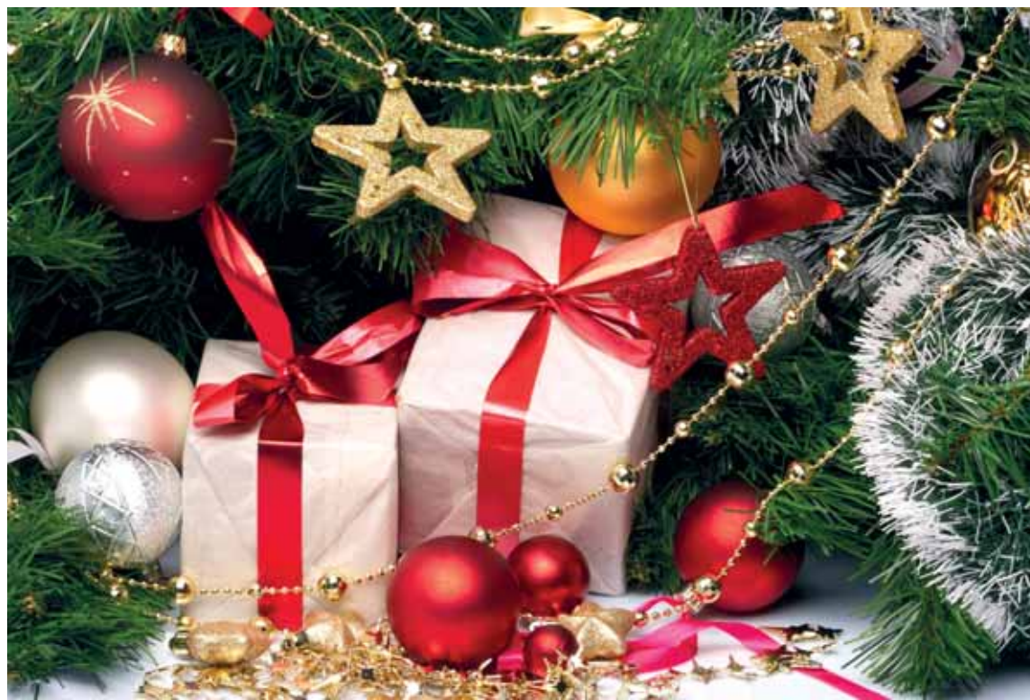
Сегодня предлагаются подарки на любой вкус, цвет и стоимость. Главное, чтобы они приносили удовольствие тем, для кого были подготовлены.

Что подарить на Год свиньи и сколько это стоит