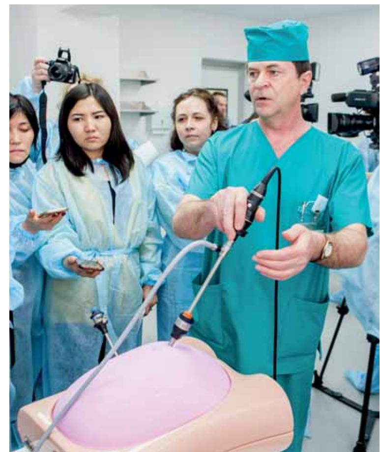
В ВКО прошла первая роботизированная операция в Казахстане.

Участвуя в съемках специального проекта про Восточный Казахстан для мировых телеканалов, нашу область посетили звезды Голливуда Майкл Сорен Мэдсен, Кэри-Хироюки Тагава, Марк Дакаскос. Съемки велись в сакральных историко-культурных местах Восточного Казахстана – на озерах Маркаколь, Рахмановских ключах, Берельских курганах, мемориальном комплексе Абая и Шакарима. «Когда я первый раз приехал в Казахстан, был джунгаром. Теперь я хочу быть