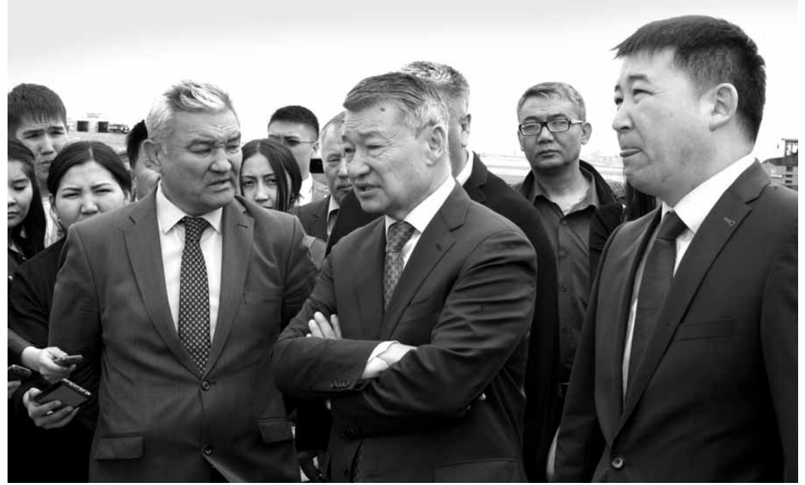
Акима сказал – аким сделал. Или нет?

Нерешенным остался и вопрос капитального ремонта в СОШ №34. Средства, выделенные на ремонт кровли и канализации, так и не пригодились. Затянувшийся на месяцы процесс государственного заказа «убил» сам ремонт. Лето закончилось, а дети остались без крыши и канализации.