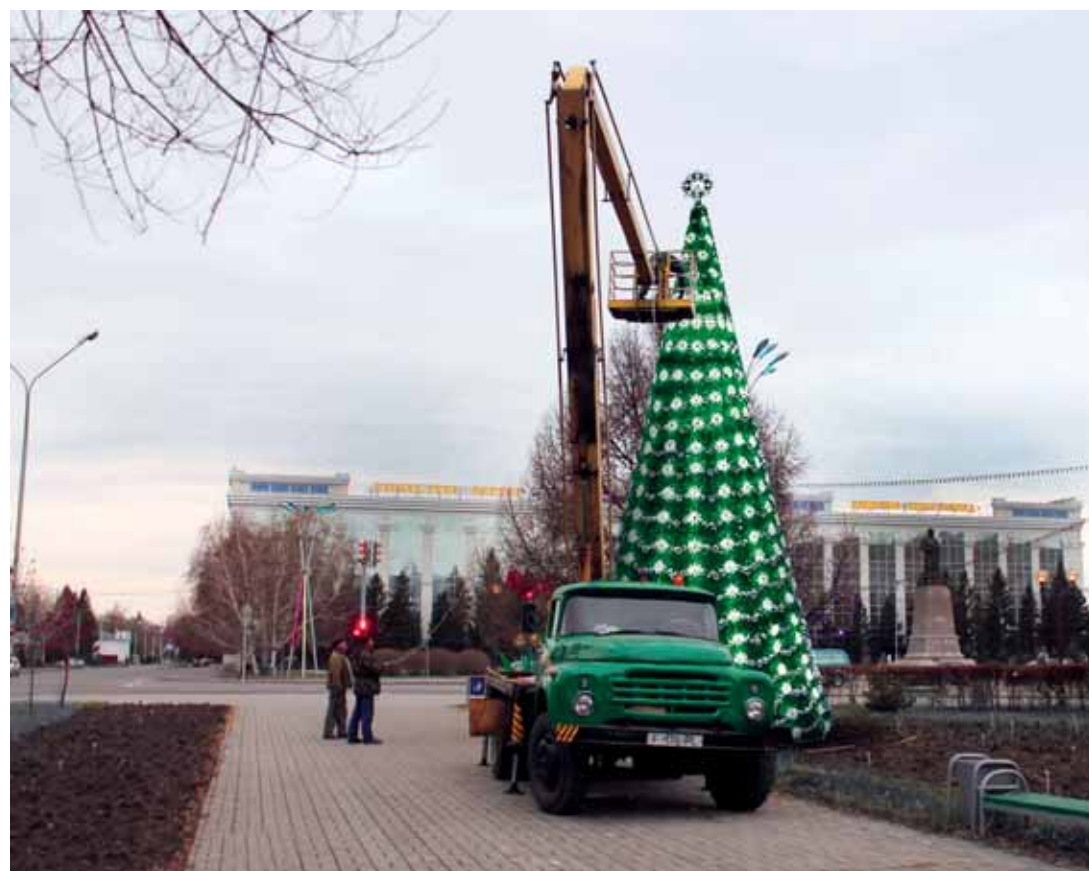
В этом году в Усть-Каменогорске впервые установили искусственную ель.

Что касается праздничного оформления зданий города, то за частные торговые центры в ответе их владельцы. Дабы подстегнуть предпринимателей, акимат областного центра объявил конкурс на лучшее новогоднее украшение. За самое оригинальное обещан приз.