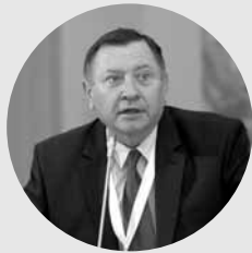
Николай РАДОСТОВЕЦ, президент Союза товаропроизводителей и экспортеров Казахстана:

«Я думаю, что принятые меры будут поддерживать экспорт. Причем не только крупный, но и средний и мелкий бизнес. Мы говорим, что у Казахстана очень выгодное геополитическое положение. Между Китаем и Европой, между Китаем и Россией – очень хорошее. А вот место Казахстана с позиции экспорта не такое уж и выигрышное, поскольку мы конкурируем по продажам с теми странами, которые имеют прямой выход к океану. Мы такого доступа не имеем, поэтому нам приходится транспортировать товары через сопредельные территории других государств, и прежде всего через Россию, у нас там большие транспортные коридоры. И все время у нас проблемы с подачей вагонов, потому что там тарифы достаточно высокие. И вообще считается, что государства, которые не имеют прямого выхода к морю, в плане экспорта очень уязвимы.