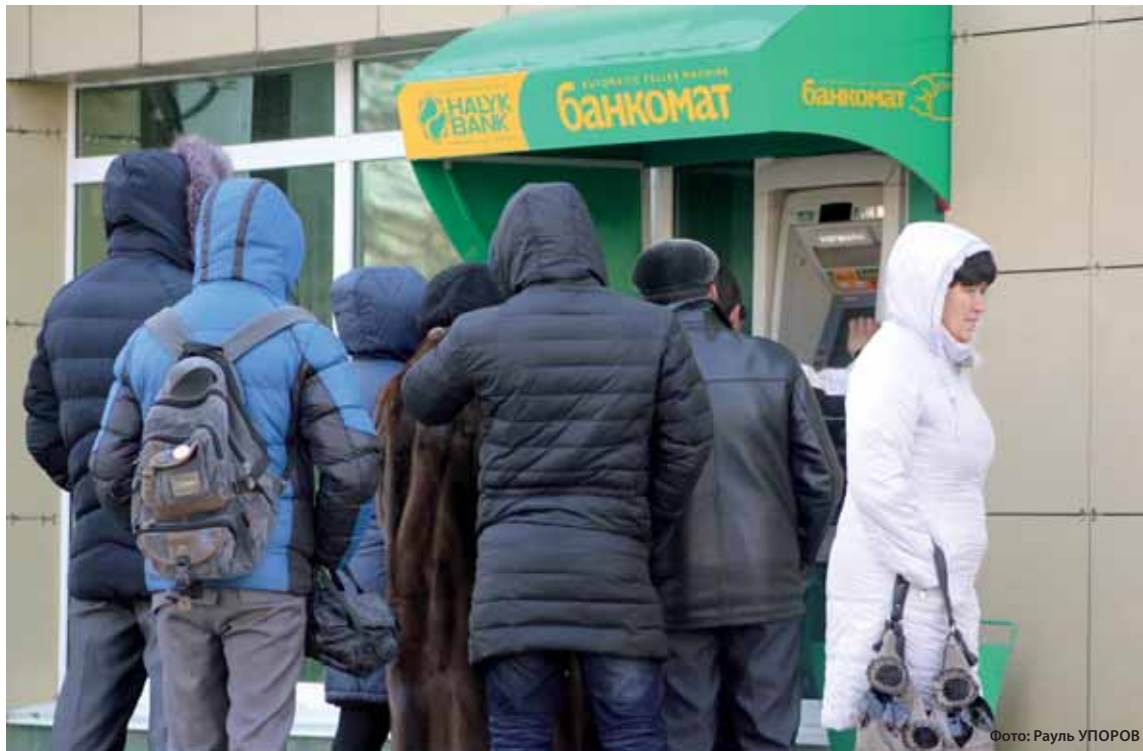
В среднем за год одна семья в РК тратит до 98% своих доходов на обеспечение потребностей – продукты, одежду, обувь, мебель, лекарства, оплату кредитов и прочее.

Как показывает статистика, несмотря на высокий уровень доходов населения в среднем по области, Мангистауская область в 2018 году являлась лидером в западном регионе по количеству бедных семей. Именно здесь 4,9% жителей области (это 6,4 тыс. семей) имеют доходы ниже величины прожиточного мини-