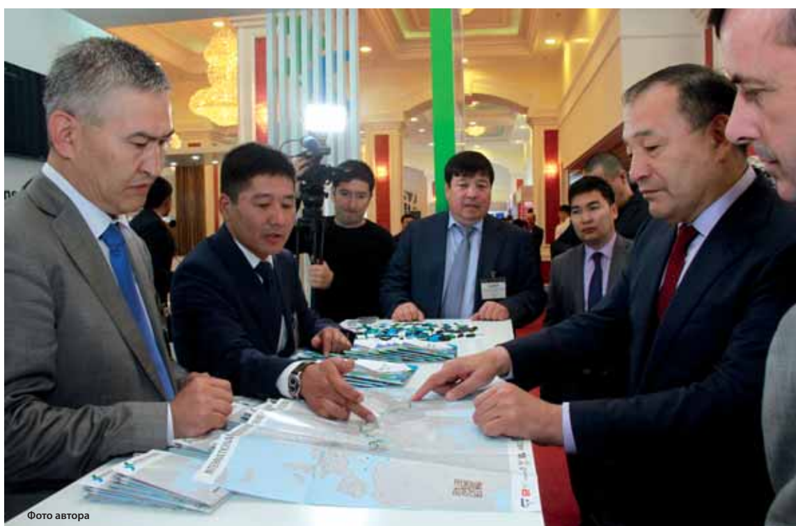
Отправка грузов через Актауский порт представляет серьезную конкуренцию альтернативным морским маршрутам.

В международной выставке-конференции приняли участие более 200 делегатов из 19 стран мира, в том числе из Казахстана, Азербайджана, Турции, Австрии, Китая, Эстонии, Италии, Грузии, Украины, Румынии, Польши. Это представители железнодорожных, морских транспортных и логистических компаний, ведущие грузоотправители, поставщики портового оборудования и услуг. Эксперты в области транспорта и логистики обсудили текущие вопросы и вызовы глобальной экономики, региональной торговли в условиях использования транспортной инфраструктуры в Каспийском регионе. Одним из главных организаторов мероприятия выступил Актауский международный морской торговый порт. Здесь несколько недель назад запустили первое в истории Казахстана фидерное судно. Именно с этого