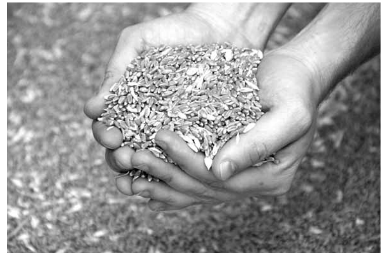
Цена на зерно достигла самой высокой отметки – 65 тыс. тенге за тонну.

ства муки и хлеба. Наша компания зерно давно продала – не было смысла его держать. Хранят только те, у кого есть свой элеватор», – сказал в комментариях «Курсиву» директор ТОО «GSB Agro» Улугбек Султан.