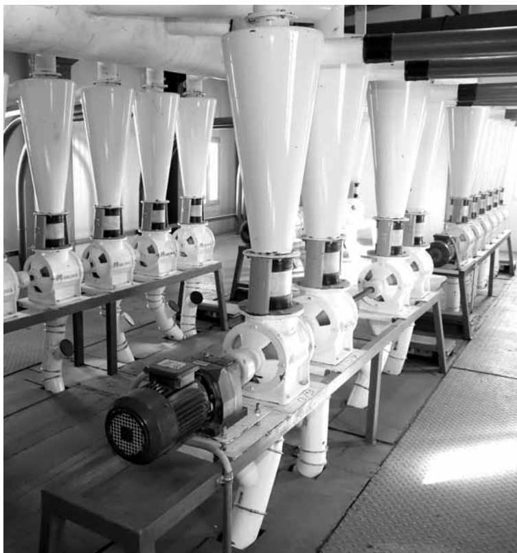
Причиной нехватки зерна предприниматели считают рост отправки казахстанской пшеницы на экспорт. С начала года через морпорт ушло 96 тыс. тонн зерновых.

Он считает, что главная проблема в том, что большая часть зерна отправляется на экспорт, а не на внутренний рынок. Мукомольный комбинат в Мунайлинском районе был открыт в конце 2017 года. Сюда зерно доставляется в основном из Костанайской области по железной дороге, здесь проверяют его качество, а затем