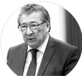
«Было зарегистрировано 24 факта нарушений своих обязательств банками в отношении клиентских счетов».

Он подчеркнул, что казахстанское законодательство предусматривает