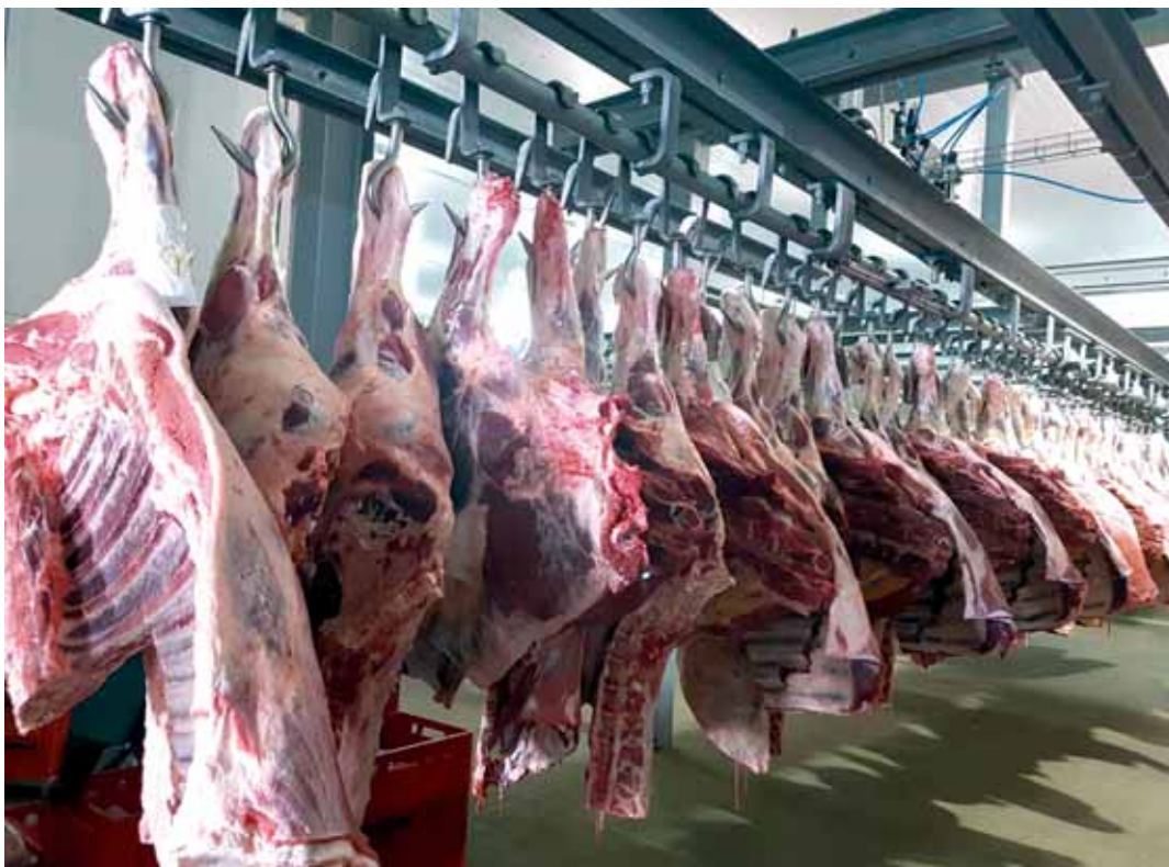
Крестьянские хозяйства поддерживаются за счет хороших цен на мясо. Его у фермеров покупают по 1525 тенге за кг. В среднем по Казахстану цена составляет 1300–1350 тенге.

По словам руководителя проекта «Актыбинский мясной кластер» Нурлана Сагналина, увеличили экспорт до 7 тыс. тонн мяса планируется уже в этом году. В сам кластер входят 500 фермеров. Упор здесь делают на